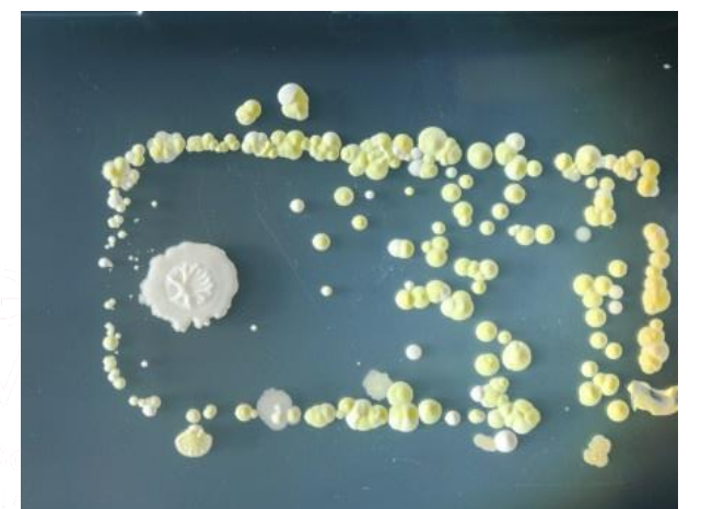
Cultivo de Pantalla de un móvil ➔