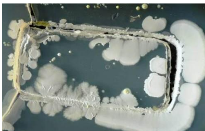
➔ Cultivo funda de móvil