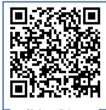
QR al procedimiento

https://www.mscbs.gob.es/profesionales/saludPublica/ccayes/alertasActual/nCov-China/